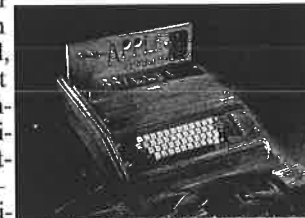
Apple-1-Computer. Abdruck mit Genehmigung der Smithsonian Institution.