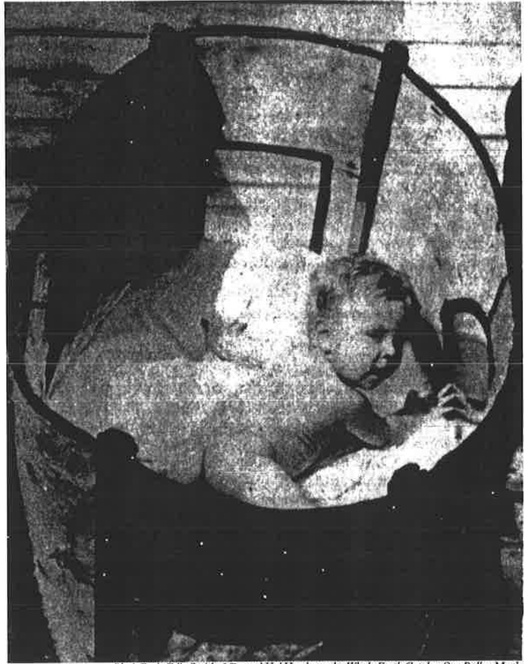
Birch Bark Crib, Smith, J.D., and Hal Hershey, eds. Whole Earth Catalog One Dollar . Menlo Park, CA: Portola Institute, September, 1970, page 32. Used by permission of Stewart Brand.

store, to serve as what they called »Community Memory.« And in the dance halls of San Francisco, musicians and light-show designers turned their new abilities to amplify sound and light into techniques for expanding the minds of dancers and acidheads.