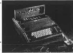
The Apple-1 computer.

In that sense, perhaps the Apple-1 was a Pygmy Gamelan too.