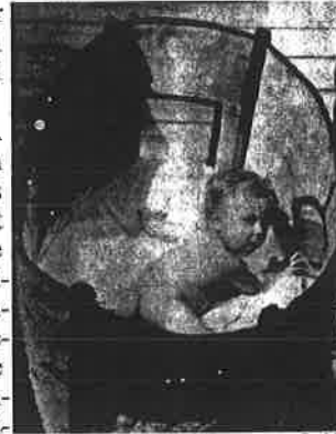
Birkenrinden-Kinderbett, J.D. Smith, und Hal Hershey, in: Whole Earth Catalog One Dollar , Menlo Park, CA: Portola Institute, September, 1970, Seite 32. Abdruck mit Genehmigung von Stewart Brand.

In diesem Sinn war der Apple-1 vielleicht auch ein Pygmy Gamelan .